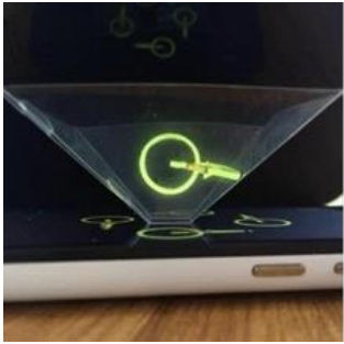
本圖為插圖 非學生教具 勿重製翻印

課中材料：3D 全息投影膜、自製 VR 眼鏡、光線三菱鏡、AR 互動作品、JSPB