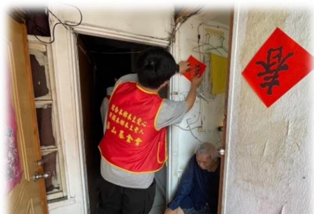
義工為阿公貼上「平安」春聯，歡喜迎接新的一年