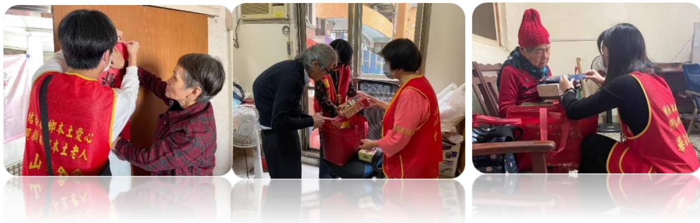
◎華山基金會 112 年服務成果：(統計自 112/01 至 112/12)